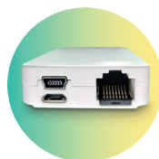
Anschluss RJ45 und USB-Speisung