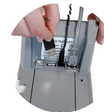
Anschluss des ORGA Protect durch Stecken des USB-Steckers in die USB-A Buchse des ORGA 6141.