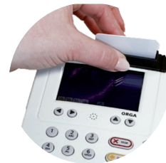
Einfache Zentrierung des ORGA Protect durch Stecken einer beliebigen Chipkarte.