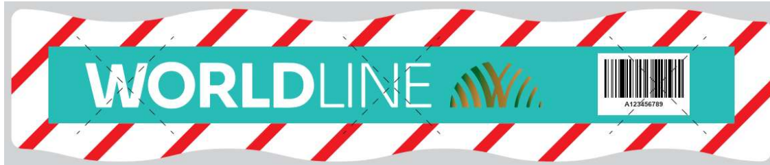
Die Abbildung zeigt ein unversehrtes Siegel.

Die folgende Abbildung zeigt das Siegel im nicht ausgelösten Zustand.