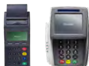
yomani touch XR AUTONOM