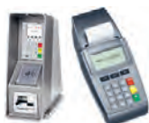
davinci SAFE AUTONOM