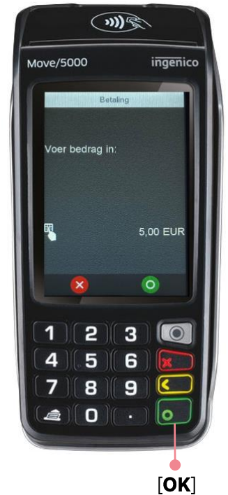
Voorbeeld geslaagde transactie