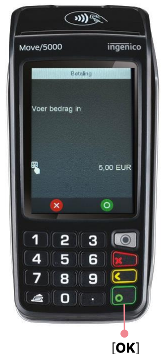
Voorbeeld geslaagde transactie