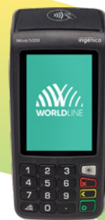
Move 5000 Trådlös terminal