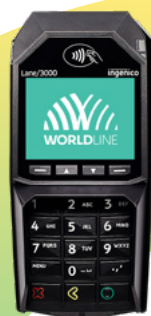
Lane 3000 Stationär terminal

Kontakta oss så hjälper vi dig hitta rätt prismodell för din verksamhet. sales.sweden@worldline.com eller +46 10 10 66 000